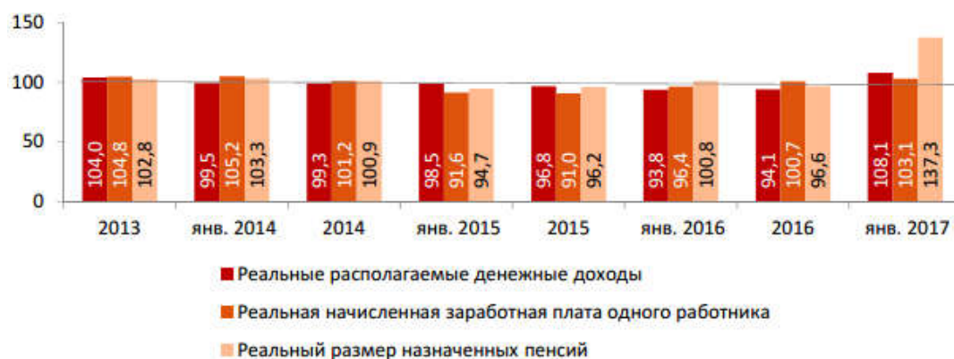
Рисунок 1 – Динамика доходов населения, %

Известно, что бедность, разрушающая трудовой и генетический потенциал села, остается массовым явлением. Отметим также и то, что бедность концентрируется в основном на сельских территориях, тогда как на долю сельского населения приходится 26 % общей численности населения страны [2].